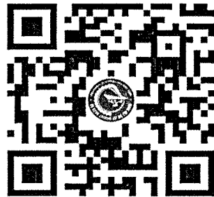
Đăng ký tham dự Hội nghị